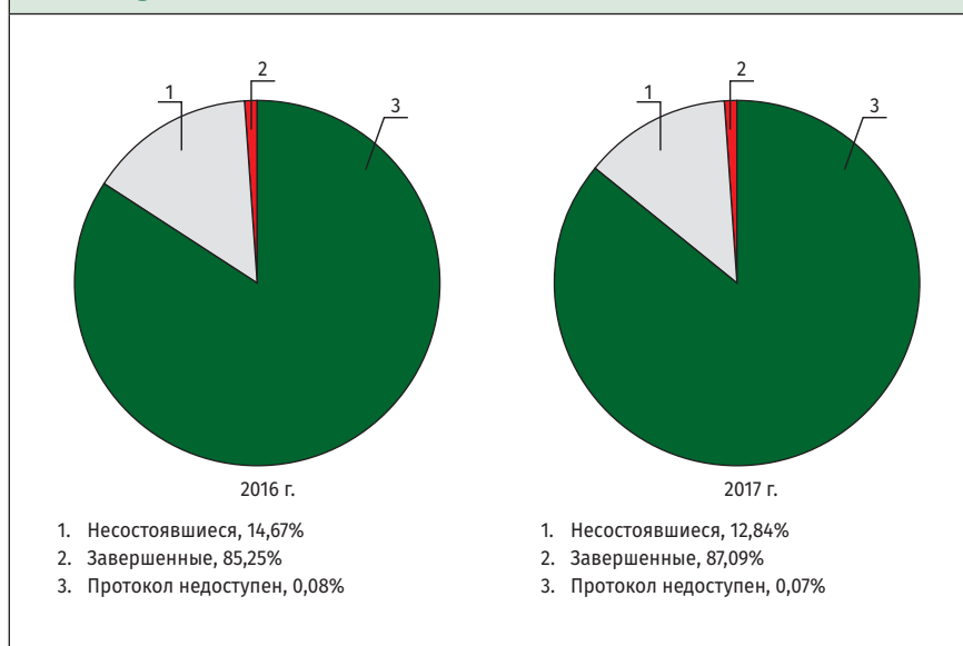
ТАБЛИЦА 3 Структура распределения объема торгов 2017–2016 гг. (в млн руб.)